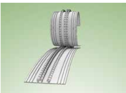
Połączenie idealnego opakowania z perfekcyjnym zamknięciem strunowym gwarantuje sukces i satysfakcję użytkownika produktu zamkniętego w opakowaniu.

Do produkcji zamków strunowych Plastmoro podchodzi w sposób precyzyjny, wykorzystując najlepszej klasy, nowoczesne urządzenia. Firma cały czas stawia na rozwój i stosowanie zaawansowanych technologicznie rozwiązań, tak aby wychodzić naprzeciw oczekiwaniom klientów. Dostępne w asortymencie producenta Perfect Zipper stanowią doskonałe rozwiązanie i dają ogrom możliwości przy pakowaniu zarówno żywności, jak i wielu innych artykułów. Dzięki solidnemu zabezpieczeniu produkty chronione są przed działaniem